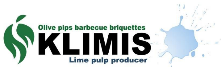
Εικόνα 1: Λογότυπο της εταιρείας