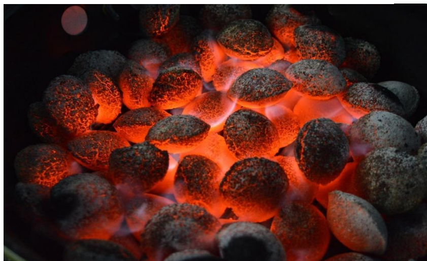
Εικόνα 2 : Μπρικέτες BBQ