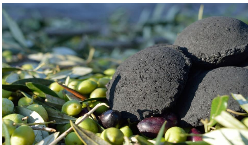
Εικόνα 3: Κουκούτσια ελιάς σε μπρικέτες BBQ